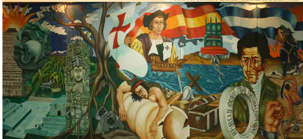
Obra de: Colectivo Escuela Nacional de Bellas Artes.

La UPNFM desarrolla planes de capacitación para estudiantes a favor de la promoción del arte, cultura y deporte en los centros regionales; por otra parte, facilita el acceso de toda la comunidad universitaria y local o regional a actividades académicas en las áreas de las ciencias y humanísticas, para la contribución a su desarrollo integral.