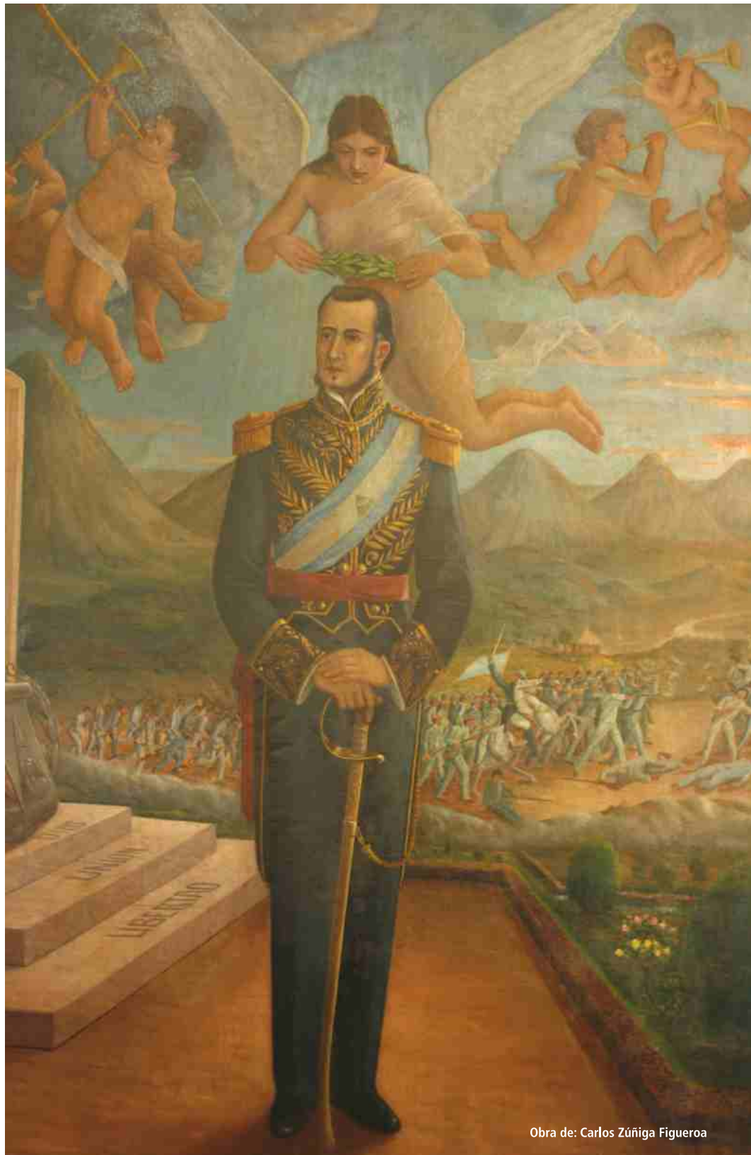
Obra de: Carlos Zúñiga Figueroa