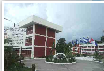
Campus La Ceiba