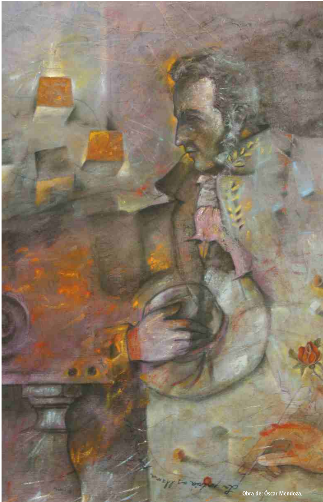
Obra de: Óscar Mendoza.