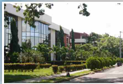
Campus San Pedro Sula