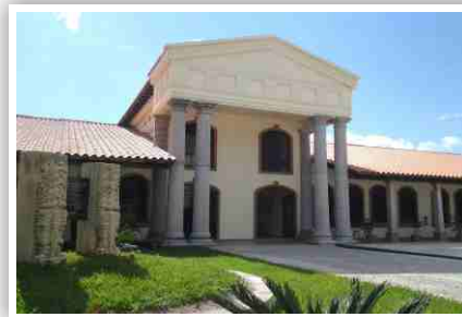
Campus Santa Rosa de Copán